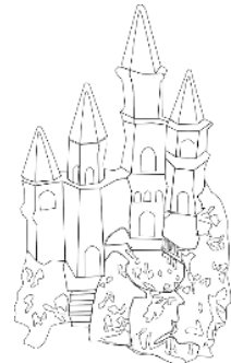
A Hókirálynő vára

5. kérdés: Miért kellett sürgősen az Óévnék a Zúzos csarnokba sietni?